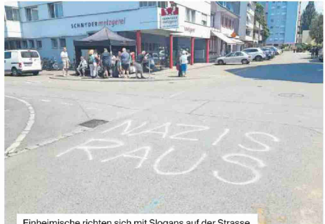
Einheimische richten sich mit Slogans auf der Strasse gegen die Vereinnahmung durch die Junge Tat in Möriken-Wildegg.