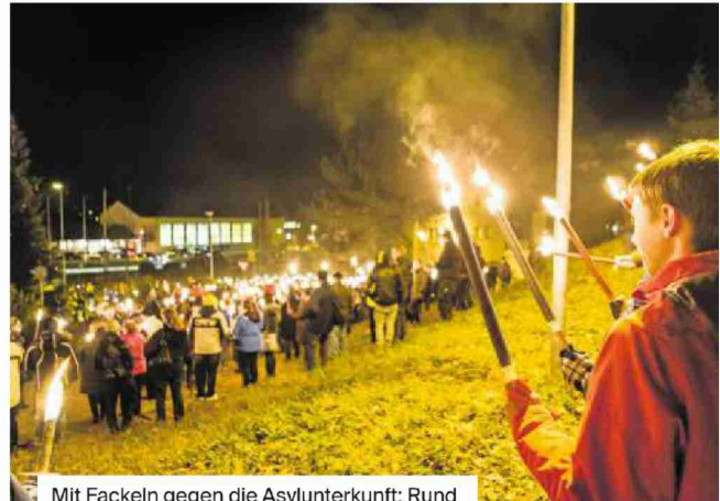
Mit Fackeln gegen die Asylunterkunft: Rund 500 Personen protestierten 2016 in Muhen gegen ein geplantes Asylheim.