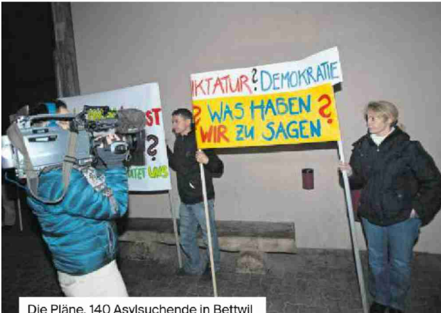
Die Pläne, 140 Asylsuchende in Bettwil unterzubringen weckte 2011 den Zorn der Bevölkerung.