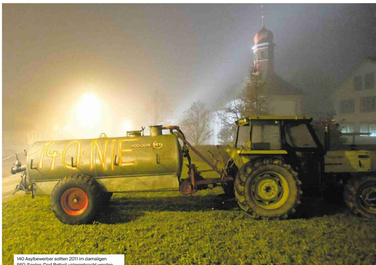
140 Asylbewerber sollten 2011 im damaligen 560-Seelen-Dorf Bettwil untergebracht werden. Die Stimmung im Dorf war explosiv.

Schwurpler und Nazis». Und auf der Strasse standen Botschaften mit Kreide: «Wildegg ohne Rassismus» oder «Nazis raus».