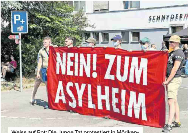
Weiss auf Rot: Die Junge Tat protestiert in Möriken-Wildegg gegen die geplante Asylunterkunft für 140 Asylsuchende.