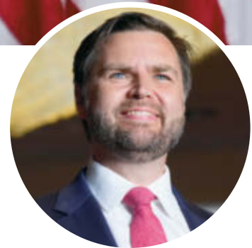
Le sénateur James David Vance sera l'un des plus jeunes vice-présidents de l'histoire américaine.

crate et Donald Trump dans l'Etat du Michigan – où le républicain l'a emporté – sont certes moins nombreuses que celles totalisées par l'ensemble des autres candidats, mais ceux-ci ont causé du tort aux deux favoris et n'ont donc pas pesé sur le résultat.