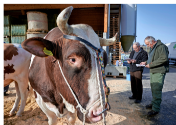
Muni-Schau in Plaffeien.

• Muni-Schau. 45 Tiere werden von zwei Experten bewertet. Viehzuchtverein Sense. Landi-Areal. Ab 12.30 Uhr.