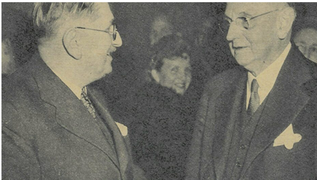
Le Fribourgeois et chancelier de la Confédération Oskar Leimgruber serrant la main du fondateur du Réarmement moral, Frank Buchman – image tirée du mensuel américain New World News.